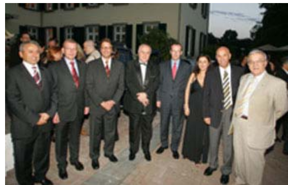
Die anwesenden Gründungsmitglieder mit den Schirmherren des Abends.

Dem Deutsch-Türkischen Club Rhein-Ruhr gehören Vertreter aus Politik, Wirtschaft, Wissenschaft, Verwaltung und Medien an, um ein Forum zum Austausch beider Kulturen anzubieten.