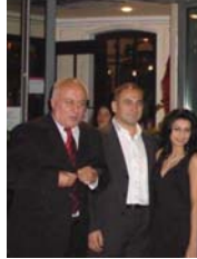
Şen, Keskin und Frau